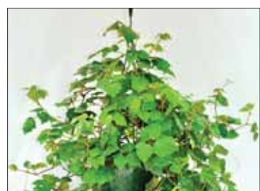
Циссус очищает и обеззараживает воздух.