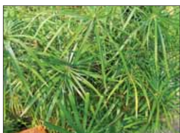
Циперус очереднолистный хорошо чистит воздух от патогенных бактерий, и его любят коты.