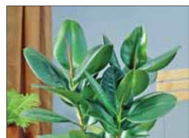
Фикс насыщает воздух кислородом и очищает от патогенных микробов.