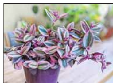
Традесканция хорошо чистит воздух и нейтрализует электромагнитное излучение.