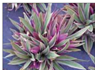
Рео пестрое хорошо фильтрует и чистит воздух.